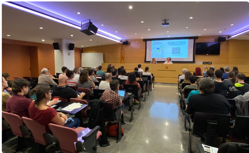
A dalt, inauguració del Fòrum, a càrrec de Pep Guasch i Ismael Peña-López. A sota, imatges dels tallers i taules rodones.